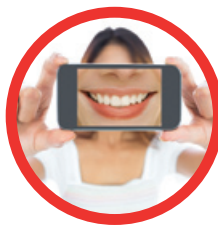
СДЕЛАЙТЕ ФОТО ДО ОТБЕЛИВАНИЯ