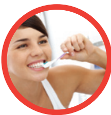
ПОЧИСТИТЕ ЗУБЫ ЩЕТКОЙ И НИТЬЮ