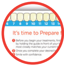
ОПРЕДЕЛИТЕ ВАШ ТЕКУЩИЙ ТОН ЗУБОВ СОГЛАСНО ШКАЛЕ